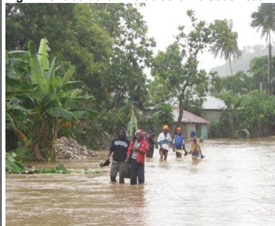
Fig.1: Rentrée de la ville de Jérémie sous l'eau

Face à ces constats, il est recommandé de: i) Assister les producteurs dans la préparation de la campagne agricole de printemps en mettant à leur disposition semences et crédit; ii) Mettre en place un programme de sensibilisation en vue d'éviter l'expansion de l'épidémie de choléra dans le département; iii) Mettre en place quatre CTC (Centre de Traitement du Choléra) au niveau du département dont un par axe et une à deux (2) UTC (Unité de Traitement Choléra) par commune; iv) Prolonger la durée de la campagne de contrôle des fourmis envahissantes en augmentant l'effectif des motivateurs et des agents d'aspersion et en élargissant la sensibilisation dans les sections non encore infestées; v) Renforcer le travail de Médecins du monde dans la Grand' Anse sur le plan nutritionnel; vi) Mettre en place des programmes à haute intensité de main d'œuvre en vue d'améliorer le revenu des ménages.