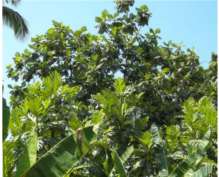
Fig. 1 : récolte de l'arbre véritable avortée